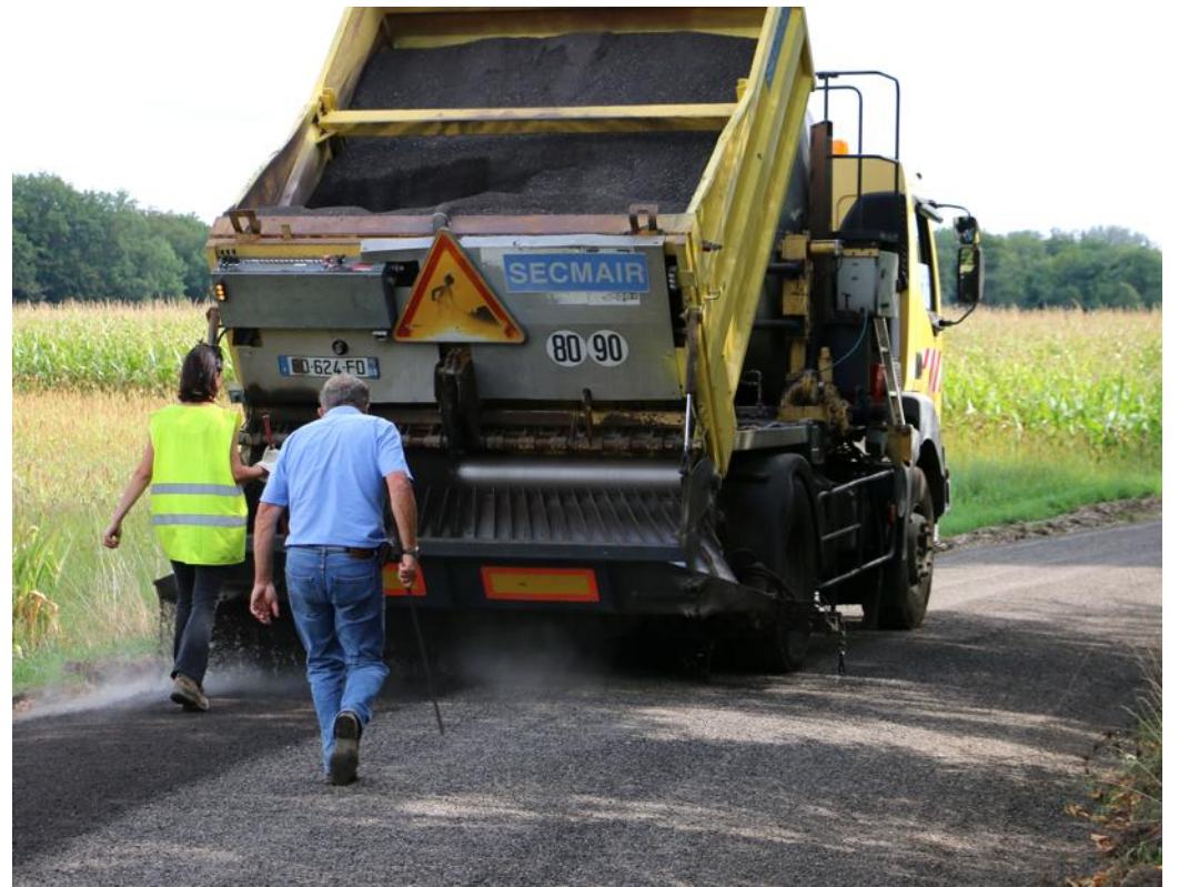
La rue du Moulin a été refaite à partir de matériaux recyclés.

Une fragmentation soignée de ces plaques d'enrobés permet de retrouver les granulats d'origine laqués de bitume résiduel. Le criblage de ces matériaux en fractions granulaires (0/6 et 6/10) permet de leur donner des opportunités de réutilisation et de valorisation. Le procédé, appelé « Alva'route », est un procédé routier innovant permettant de créer une