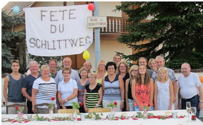
Les voisins se sont retrouvés dans la convivialité.

Pour la 11 e année consécutive, les riverains de la rue du Schlittweg se sont retrouvés samedi dernier pour leur traditionnelle fête de rue.